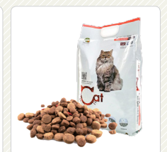
Thức ăn cho động vật