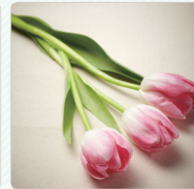
Hoa (hoa đã cắt)