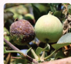
Bệnh cháy lụi trên cây ăn quả