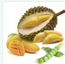
Trái cây tươi, rau quả