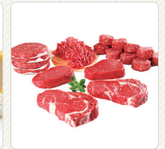
Sản phẩm từ thịt