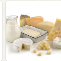
Sản phẩm từ sữa