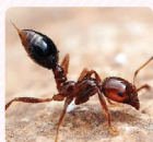
Kiến lửa đỏ