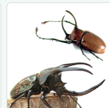
Côn trùng còn sống