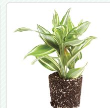
Thực vật còn dính đất