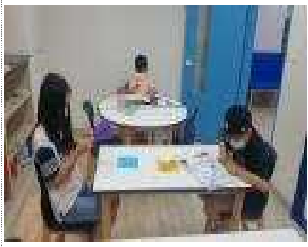
검단나눔터 - 긴급돌봄교실

코로나-19로 인해 유아 및 초등학생 대상으로 긴급돌봄교실을 운영하고 있습니다. 평일 9시부터 18시까지 운영하고 있으며 발열체크(2회 이상) 후 등하원을 원칙으로 하고 있습니다. 실내에서는 마스크를 착용하며 적절한 거리를 두고 수시로 환기와 소독, 청소로 안전한 공간을 제공하고 있습니다.