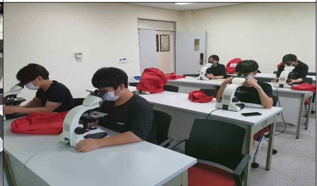
플랑크톤 현미경 관찰