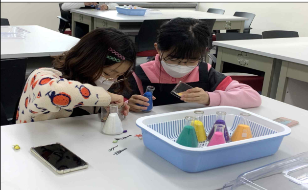
바다 환경의 이해(미니어항 만들기)