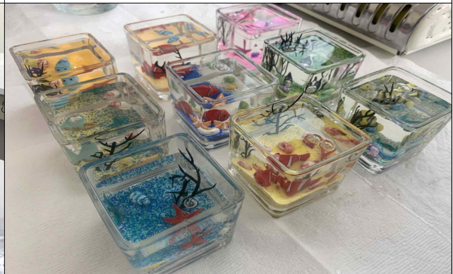
바다 환경의 이해(미니어항 만들기)