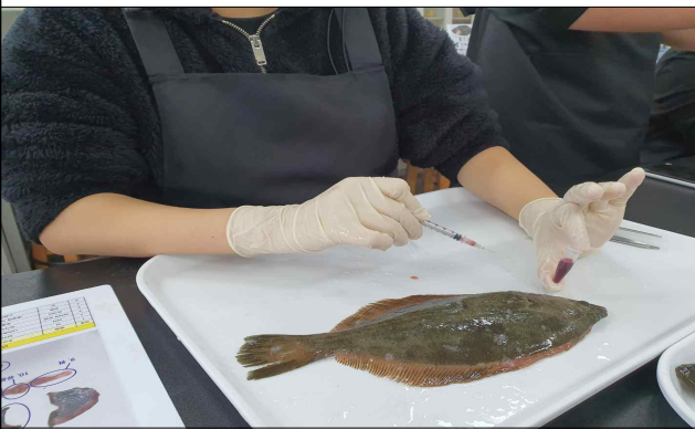
어류 혈액 관찰